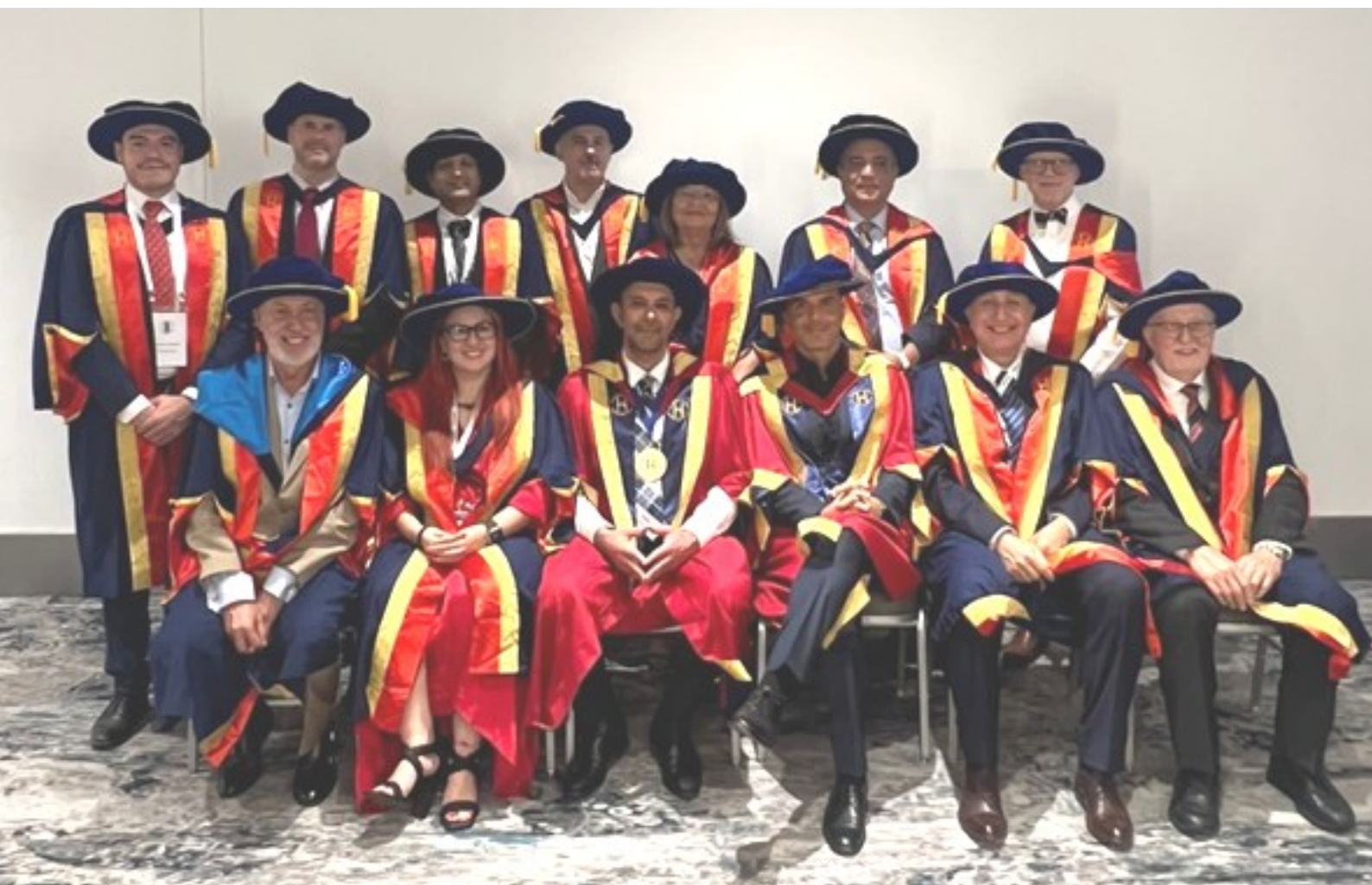
Comité Ejecutivo UIP 2022-2025

Cualquier necesidad, no dude en ponerse en contacto conmigo gnsrg@unife.it t. +393498012304)